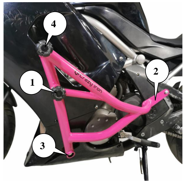
Рис.2. Установленная клетка вид слева