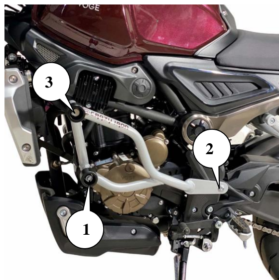
Рис.2. Установленная клетка вид слева