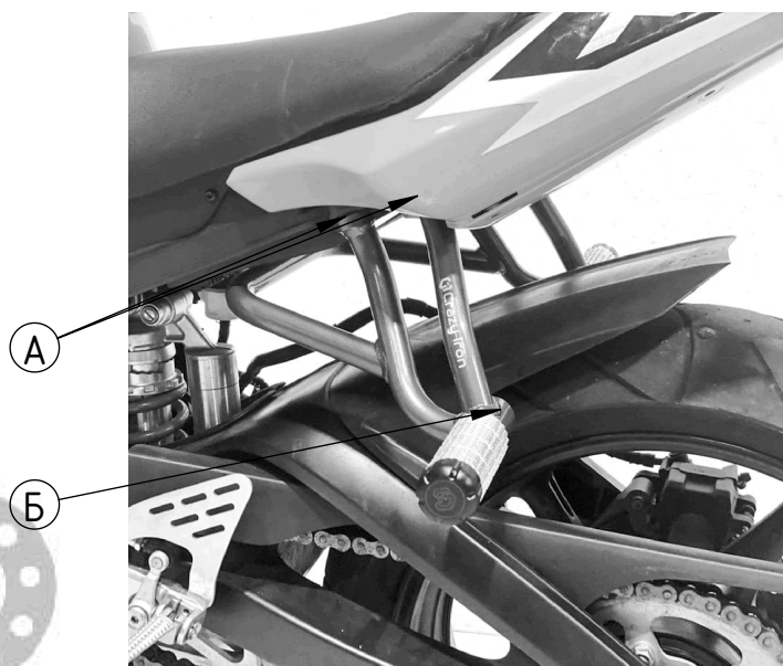
Рис 2 Установленный садкейдж, вид слева.