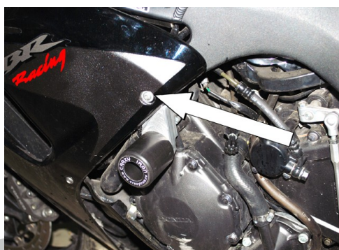
Схема сборки (стрелками указано место болта №5 вместо штатного)