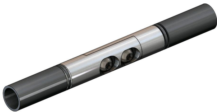
Рис.4 Кронштейн крепления дуг между собой (точка 3)