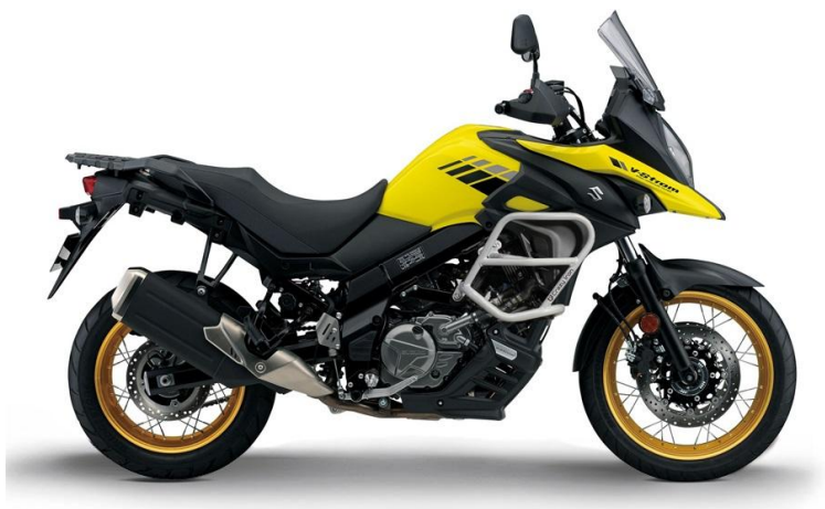
Дуги SUZUKI DL650 V-Strom `17- ID: 209611