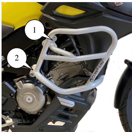
Рис.1 Установленная клетка вид справа