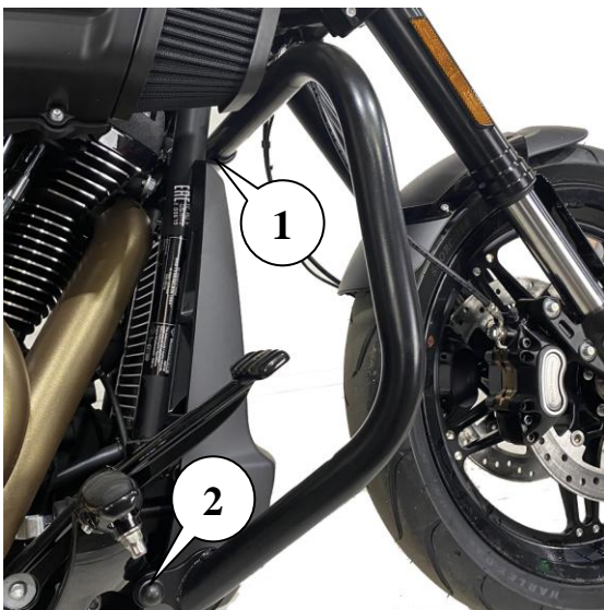
Рис.1. Установленная защита вид справа