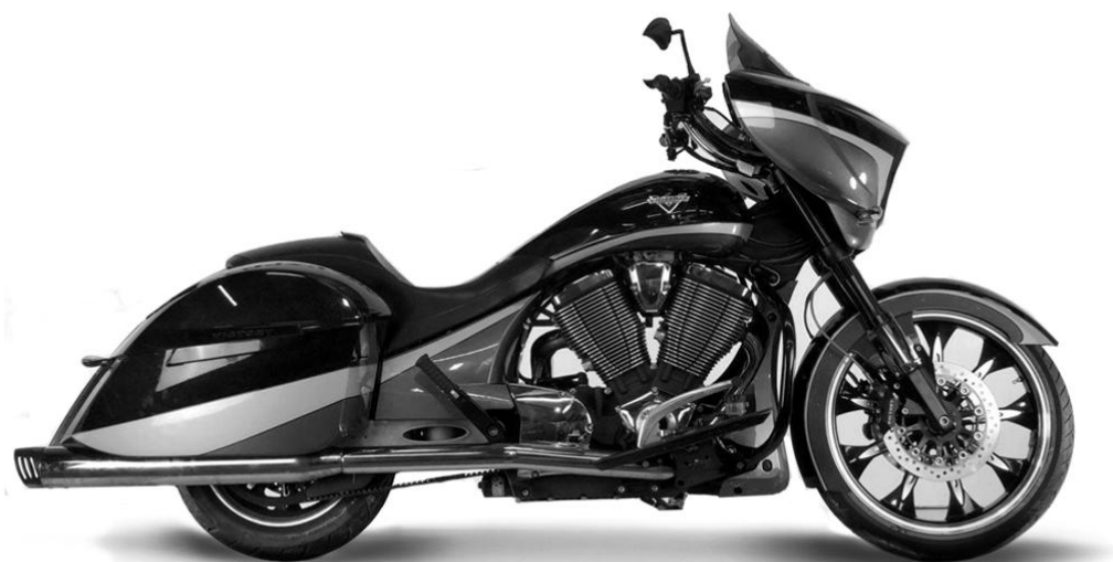
VICTORY Cross Roads Classic, Cross Country ID: 65053