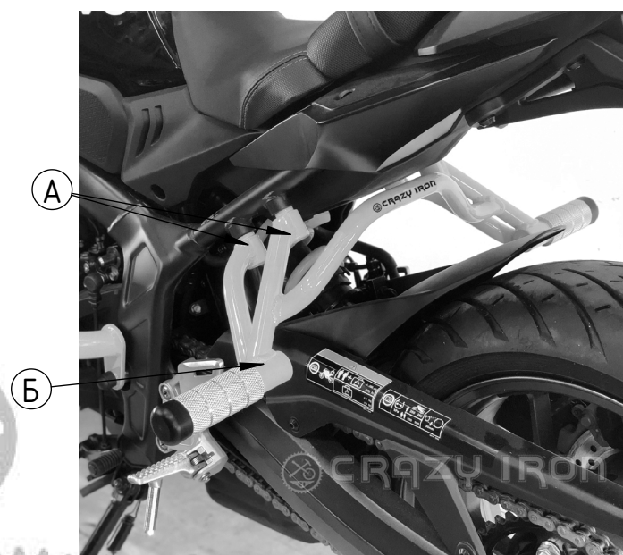
Рис 2 Установленный садкейдж, вид слева.

Устанавливается на посадочные места заводских штатных подножек.