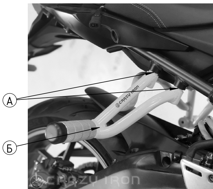
Рис 1 Установленный садкейдж, вид справа