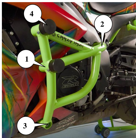
Рис.2. Установленная клетка вид слева