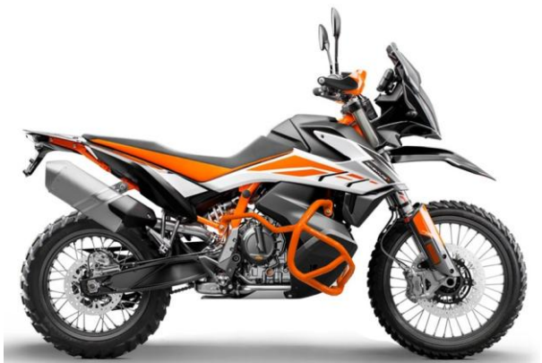
Нижние дуги KTM 790 ADVENTURE ID: 90081