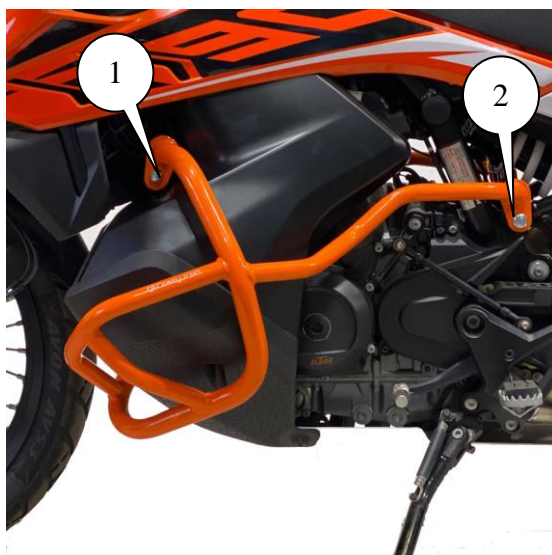
Рис.1. Установленная клетка вид слева