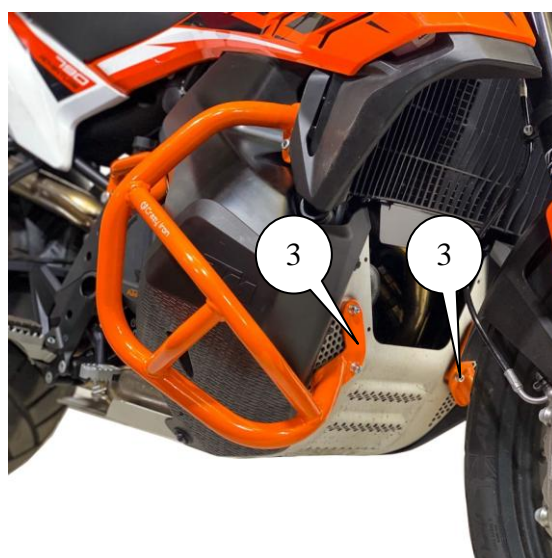
Рис.3. Установленная клетка вид слева спереди