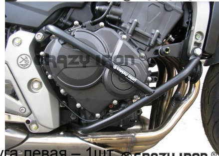
1 - Дуга левая – 1шт. CRAZY IRON®